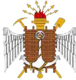
“Crisol de la ciencia y el honor”